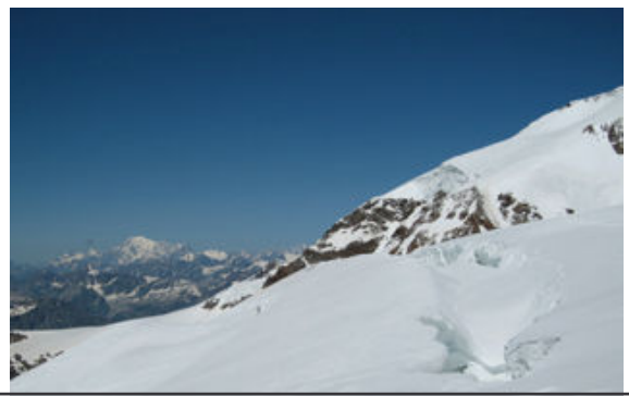
Passage Nez du Lyskamm et Mt Blanc