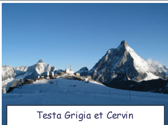
Testa Grigia et Cervin

Tout commença il y a une semaine, à Cervinia, par une course contre la montre pour ne pas louper la dernière benne. Jamais la pression du temps qui passe ne fut aussi insupportable, jamais nous ne fûmes aussi rapide pour nous équiper et boucler notre sac, jamais, autant chargé, nous ne courûmes aussi vite. A 15h15, à l'heure prévue, le téléphérique de 150 places démarrerait avec, seuls à bord, les six membres de l'équipe Frouzins Montagne, tous transpirants et haletants. Il nous déposa à Testa Grigia, 1400 mètres au dessus. En sortant, l'air vif de l'altitude nous rafraîchit, le paysage de champ de neige d'une station de ski nous surprit, la descente vers le Refuge Teodulo nous ravit, d'habitude on arrive au refuge par le bas !