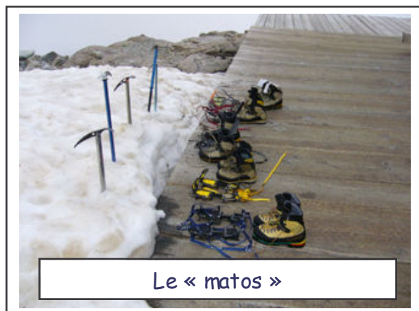
Le « matos »