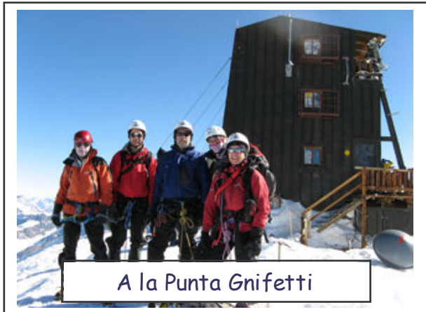
A la Punta Gnifetti

La montée pour atteindre ce col fut longue et éprouvante, car, proche du but, nous eûmes tendance à sous évaluer la distance ; de plus le profil convexe du terrain nous masquait la véritable crête, nous laissant croire à chaque pas que l'arrivée était imminente. Enfin, elle fut là, nous y fîmes une pause. La dernière partie fut réalisée rapidement dans une trace élégante en Face Nord, dominant notre itinéraire. Quelle joie ce fut de se retrouver tous ensemble au sommet, un sommet surprenant puisque équipé d'un refuge tout en hauteur et haubané ... nous y restâmes relativement longtemps pour les photos, le panorama, le plaisir ... il faut dire que le temps était superbe, et l'atmosphère calme.