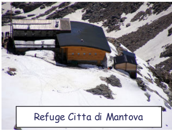
Refuge Citta di Mantova

De retour au refuge, nous profitâmes une dernière fois de sa terrasse belvédère, puis nous fîmes nos sacs et descendîmes au refuge Citta de Mantova, pour la suite de notre semaine. Des le sas franchi, nous comprîmes que nous étions de nouveau dans un authentique refuge montagnard. Nous y retrouvâmes le calme et la sérénité.