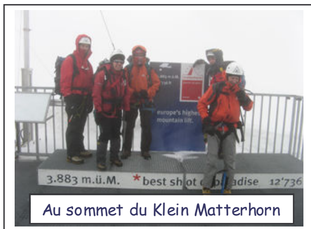
Au sommet du Klein Matterhorn

En fin d'après midi, dans la grande salle commune, le soleil entrait par une immense baie vitrée, nous offrant une vue immense sur Cervinia, le Valtournanche, et ses sommets grandioses. Nous attendîmes ainsi, patiemment, que le Cervin se dévoile. Au repas, nous découvrîmes l'hospitalité italienne, qui n'est pas spécifique de ce refuge, et qui se renouvellera les soirs suivants : en entrée, nous avons le choix entre la soupe de légumes frais et les pâtes en sauce, ensuite, le choix entre deux plats, et au dessert un nouveau choix entre les fruits au sirop ou la crème « Mont Rose », un délice très apprécié par Fred.