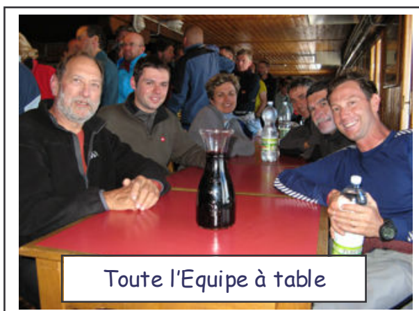
Toute l'Equipe à table

Le refuge était complet (entre 170 et 330 places suivant la source d'information !) et il fallait constamment faire la queue : pour s'enregistrer, pour utiliser les toilettes (il faut dire, à la décharge des utilisateurs, que la vue sur le glacier et ses séracs y est exceptionnelle), pour commander à boire, pour prendre le repas du soir, pour prendre le petit déjeuner ... ainsi, nous avons le temps de visiter le site : au premier niveau la fameuse terrasse et son bar, au second, le restaurant, au troisième et au quatrième les chambres, qui donnent sur le sommet de cette crête rocheuse, lieu de départ des courses et où est construite la chapelle. Après le repas, je m'offris une promenade digestive sur la longue terrasse, assistant à la naissance des étoiles.