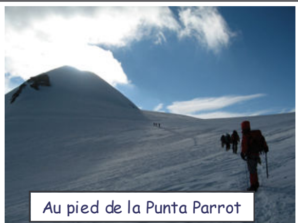
Au pied de la Punta Parrot

Le lendemain, il n'y eu aucun stress car nous étions seulement quatre groupes à partir vers les sommets. L'échauffement fut réalisé lors de la montée progressive entre les deux refuges, de sorte que nous étions en pleine possession de nos moyens à la jonction avec les cordées parties de Gnifetti. Alors, et connaissant maintenant les lieux, ce fut un vrai bonheur que d'optimiser notre cheminement en conservant une pente régulière, nous trouvant systématiquement au dessus des autres cordées, dans cette montée laborieuse, jusqu'au replat à 4000. Au delà, nous progressâmes au rythme de notre respiration, les yeux tantôt dans la trace, tantôt dans les cieux, tantôt sur les sommets. Au dessous de nous, dans les vallées, il y avait la mer de nuage, et au dessus des sommets, il y avait aussi des nuages. Nous espérons que cette situation perdure ainsi.