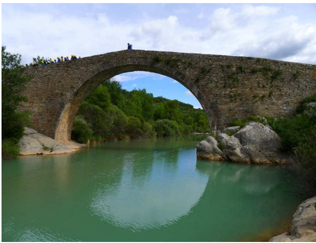
El Puente de Pedruel

Nous démarrons du Camping del Puente (Puente de Pedruel), à 9h (altitude : 630M), et nous prenons l'ancien sentier, bordé de murettes, qui nous emmène, en longeant les champs, jusqu'au Village de Rodellar (altitude : 750m)