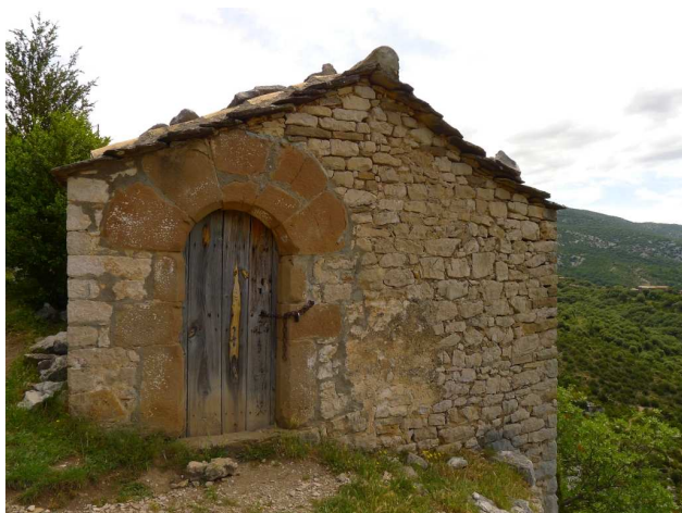
La Virgen del Castillo

Nous continuons le sentier, traversons le Barranco de la Virgen (altitude : 750m) et remontons le sentier à flanc sud jusqu'à l'Hermitage du XII siècle de « La Virgen del Castillo » (altitude : 820m).