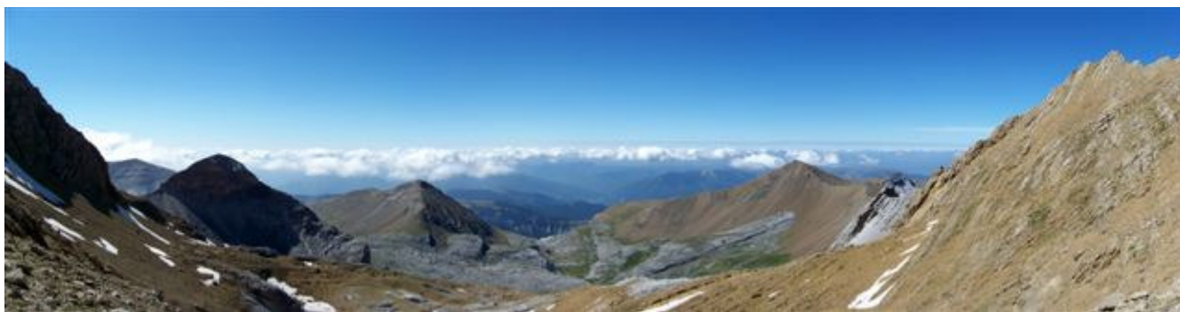
Vue du Col des Gabietous vers le sud

Ensuite hum, les cairns se perdent, on tourne, on monte en pleine pente en direction N puis N-E, jusqu'à atteindre le Col des Gabietous 2935m. De là, chouette on laisse nos sacs pour faire les quelques mètres restant pour le premier sommet, le Gabietou Oriental à 3031 m ! La vue est sublime ... en particulier sur le Massif du Vignemale mais aussi sur le Taillon tout proche. Après quelques photos nous voilà partis à l'assaut de l'autre Gabietou (l'Occidental) qui nous semble tout près, mais après avoir fait plusieurs montées et descentes, on s'aperçoit qu'il est trop loin, impossible de rester en crête on fait donc un retour vers le Col. Une petite pause s'impose, on a tous bien faim ... 15 min top chrono ☺