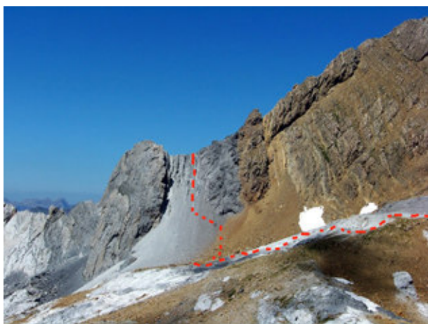
Vue depuis le Col Blanc sur l'itinéraire parcouru

Ensuite hum, les cairns se perdent, on tourne, on monte en pleine pente en direction N puis N-E, jusqu'à atteindre le Col des Gabietous 2935m. De là, chouette on laisse nos sacs pour faire les quelques mètres restant pour le premier sommet, le Gabietou Oriental à 3031 m ! La vue est sublime ... en particulier sur le Massif du Vignemale mais aussi sur le Taillon tout proche. Après quelques photos nous voilà partis à l'assaut de l'autre Gabietou (l'Occidental) qui nous semble tout près, mais après avoir fait plusieurs montées et descentes, on s'aperçoit qu'il est trop loin, impossible de rester en crête on fait donc un retour vers le Col. Une petite pause s'impose, on a tous bien faim ... 15 min top chrono ☺