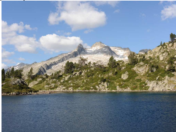
Gourguet de Madamete

Au col de Madamete, nous jugeons que la crête en direction du Pic d'Estibere n'est pas praticable, et nous revenons donc sur nos pas, jusqu'au Gourguet de