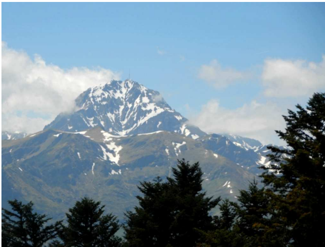
Le Pic du Midi

Merveilleuse descente : JeanS prend le temps de Photographier le Prince des Pyrénées sous son meilleur angle ... Nos yeux s'imprègnent et balayent la chaîne inondée de Soleil : Montaigu, Pic du Midi de Bigorre, 4 Thermes, l'Arbizon et se fondent dans le Luchonnais.