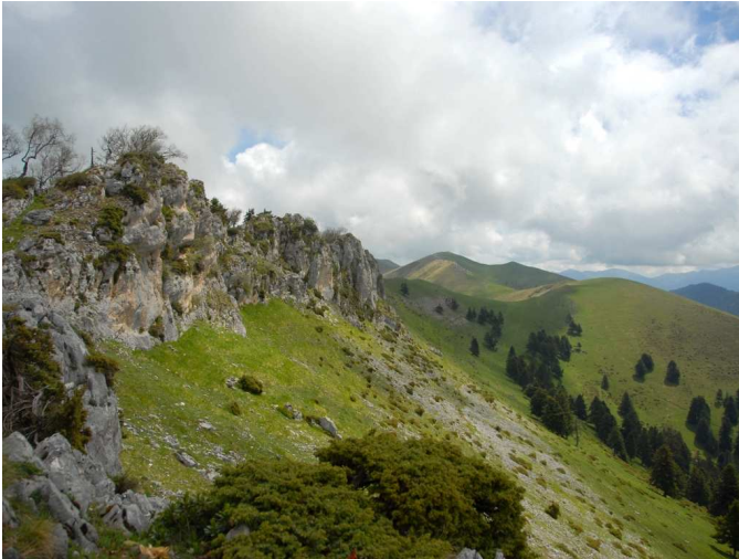
La Crete de Bassia