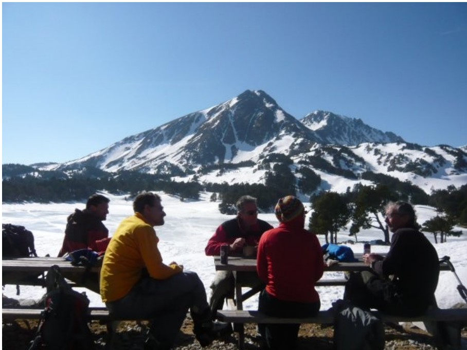
Les Péric, depuis la terrasse du refuge