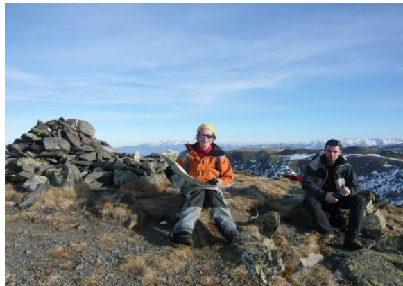
Au sommet de la Muntanyeta

Programme de l'après midi : exercices recherche DVA, coupe de neige, analyse du manteau neigeux, exercices de rétablissement avec ou sans piolet en cas de chute. Finalement certains chaussent les skis pour faire une petite descente, d'autres montent au pic de la Muntanyeta.