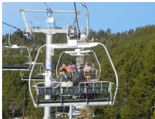
Sur le télésiège

Ce vendredi 11 février, nous nous retrouvons à Frouzins pour un départ à 5h du matin. Après plus de 3h de route, nous arrivons à Formiguères dans les Pyrénées Orientales. Il fait un temps magnifique, qui devrait tenir jusqu'à dimanche.