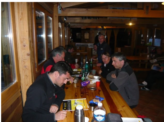
Soirée au refuge

On se retrouve vers 18h pour l'apéro au refuge ! Nous repérons le couloir d'alpinisme du lendemain sous les conseils avisés du gardien. Le gardien et la gardienne nous ont préparé un bon repas pour une première soirée sympathique et bien arrosée.