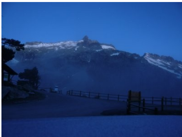
Le Néouvielle depuis le lac d'Aubert, 5h30 du matin, prise de vue sur 30 secondes