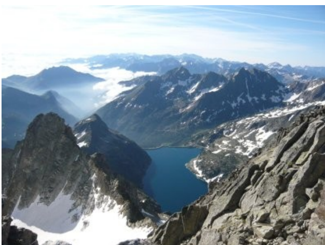
Le Ramougn, le lac de Cap de Long, la mer de nuage