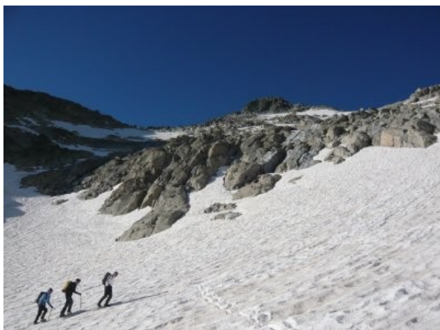
On voit le sommet, encore un effort!

de Long (2160m). A nos pieds également les lacs d'Aubert et d'Aumar.